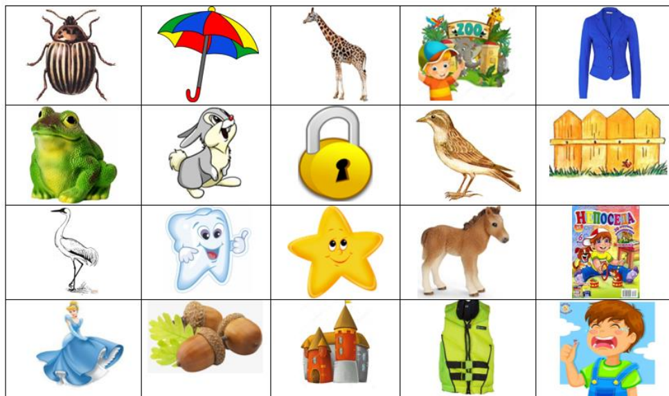
Дидактическая игра «Найди звуки Ж, З»